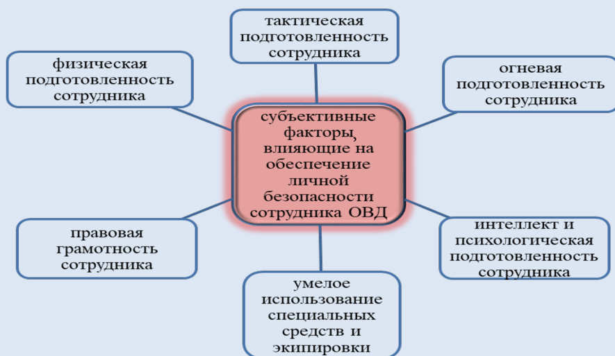
Рис. 1. Субъективные факторы, влияющие на уровень личной безопасности сотрудника ОВД в экстремальной ситуации

Помимо этого руководителям всех уровней необходимо помнить, что при формировании функциональных групп распределять личный состав по предназначению необходимо с учетом уровня физической подготовленности, морально-психического состояния и опыта профессиональной деятельности в условиях осложнения оперативной обстановки, учитывая при этом шесть основных субъективных факторов, влияющих на обеспечение личной безопасности сотрудника в рассматриваемых условиях (рис. 1).